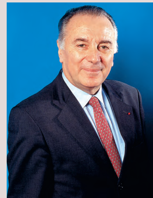
CG92 / O. RAVOIRE

Une autre perspective s'ouvre grâce à son intégration à l'ensemble patrimonial voulu par le conseil général avec l'arbo-retum, le parc départemental,